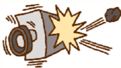
衝突や接触など不慮の事故による破損