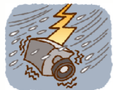
台風・落雷などの風水害