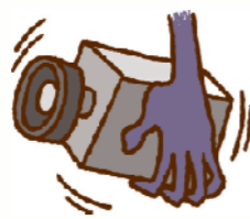
盗難やいたずら被害